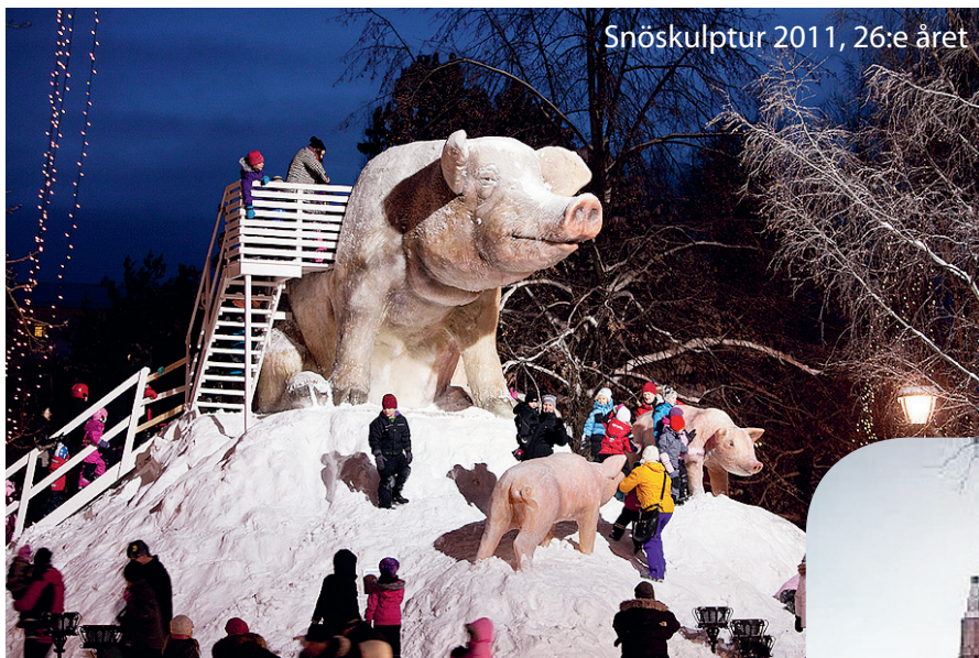
Snöskulptur 2011, 26:e året